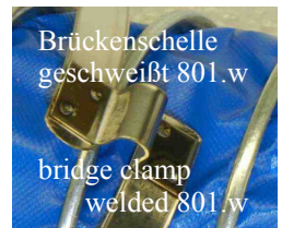
Brückenselle geschweißt 801.w bridge clamp welded 801.w