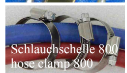
Schlauchschelle 800 hose clamp 800