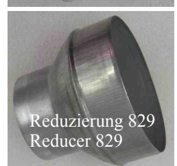
Reduzierung 829 Reducer 829