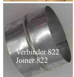
Verbinder 822 Joiner 822