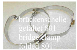
brückenselle gefaltet 801 bridge clamp folded 801